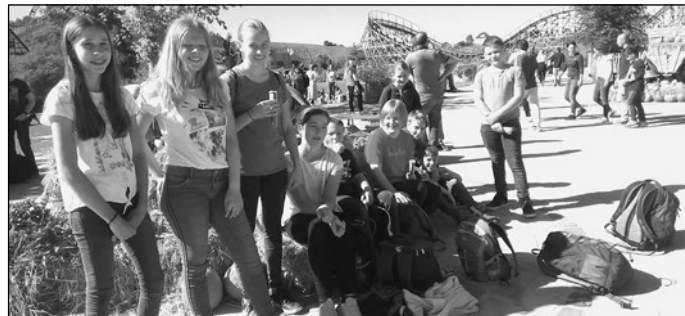
Einige Jugendliche des JBO SOS beim Ausflug nach Tripsdrill.

Das Jugendblasorchester SOS hatte am Samstag, 21. September, einen tollen Tag in Tripsdrill. Schon früh am Morgen ging es los. Das Wetter spielte mit, und so machten die zehn mitgereisten Jugendlichen mit ihren Betreuern sämtliche Fahrgeschäfte unsicher. Die Fahrt mit der Achterbahn „Karacho“ oder „Mammut“ war ein spannendes Highlight. Die Wildwasserbahn durch den Jungbrunnen sorgte für die nötige Abkühlung. Geschafft und gut gelaunt traten wir am Abend wieder die Heimreise an.