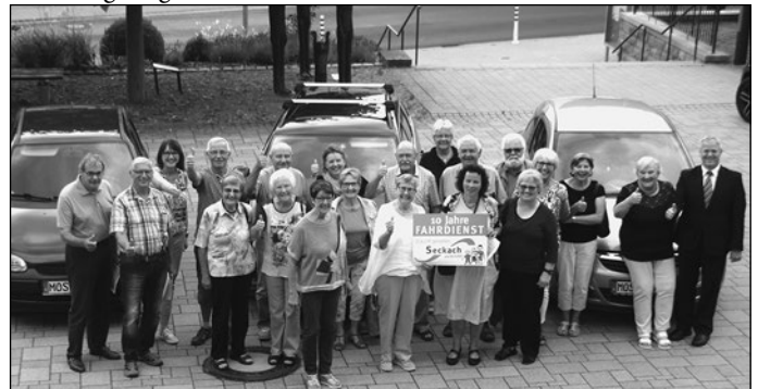
Daumen hoch für den Fahrdienst, der jetzt sein 10-jähriges Bestehen feiern konnte!

Hinweis: über die beeindruckende Leistungsbilanz des Fahrdienstes kann man sich bis auf Weiteres auch im Foyer des Rathauses informieren, wo auf zwei Stellwänden „Zahlen, Daten und Fakten“ zusammengetragen wurden.