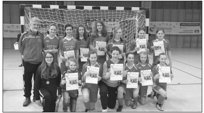
Unsere Aufnahme zeigt die Mannschaft bei der abschließenden Siegerehrung in Ellwangen.

Turniersieger wurde am Ende der SV Leonberg/Eltingen, aber auch die SCK-Kickerinnen samt Anhang konnten zufrieden die Heimreise antreten und werden aus dieser so hervorragend verlaufenen Hallenrunde mit Sicherheit noch lange Energie, Spielfreude und Gemeinschaftsgeist schöpfen.