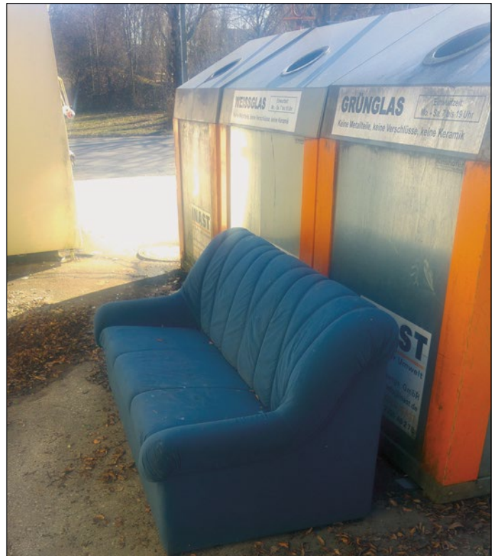
Unsere Aufnahme zeigt die Fläche hinter den Glascontainern in Großeicholzheim

Bereits in der Vergangenheit hat die Gemeindeverwaltung die Bevölkerung des Öfteren auf wilde Müllablagerungen aufmerksam gemacht. Aktueller Schwerpunkt sind die Glascontainer am Parkplatz Schlossgartenhalle Großeicholzheim. Dort wurde ein blaues Sofa entsorgt.