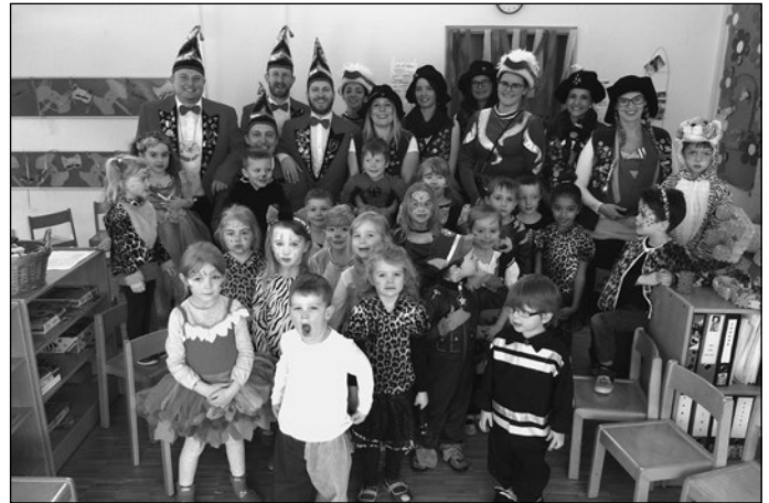
Vielen Dank der FG Seggerner Schlotfeger !!

hieß es auch dieses Jahr wieder im Kiga St. Franziskus in Seckach. Schon in den Wochen vorher wuchs ganz langsam der Urwald in Flur und Gruppenräumen und lockte manche Tiere an. So konnte am Schmutzigen Donnerstag die Party im Dschungel steigen. Pünktlich um 13.31 Uhr marschierten dann noch Gardemädchen, Elferräte und Schlotfeger ein und es gab einen stimmungsvollen Höhepunkt, der als Abschluss auch noch eine süße Überraschung für alle Dschungelbewohner brachte.