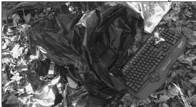
Müllablagerung im Kammweg