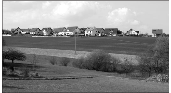
Die Aufnahme zeigt das geplante künftige Baugebiet „Steinigacker-Gänsberg II“, aufgenommen aus Richtung Süden.

Finanzen: Die solide Haushaltspolitik der Gemeinde soll weiter fortgesetzt werden. Nach 13 Jahren (!) ohne Kreditaufnahme sieht der Haushalt 2017 zwar eine solche in Höhe von 165 000 Euro vor, welcher aber eine Tilgung von 233 000 Euro gegenüber steht.