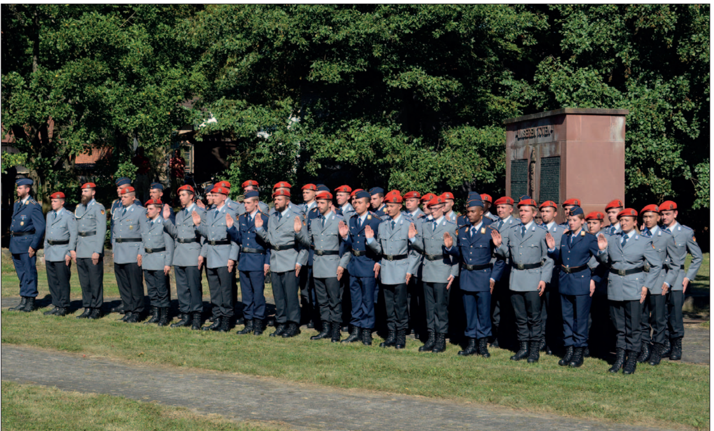
Unsere Aufnahme zeigt die Rekruten bei der Ablegung ihres Gelöbnisses.

Seckachs Bürgermeister Thomas Ludwig nutzte den Rahmen des Gelöbnisses, um darauf hinzuweisen, „dass Demokratie und Freiheit sowie Rechtsstaatlichkeit und politische Mitwirkungsrechte für einen Großteil der Weltbevölkerung nicht selbstverständlich sind“. Auch in Europa habe man sich diese Errungenschaften auf einem langen Weg hart erarbeiten müssen. Leider seien diese Grund- und Freiheitsrechte zurzeit verstärkt in Gefahr