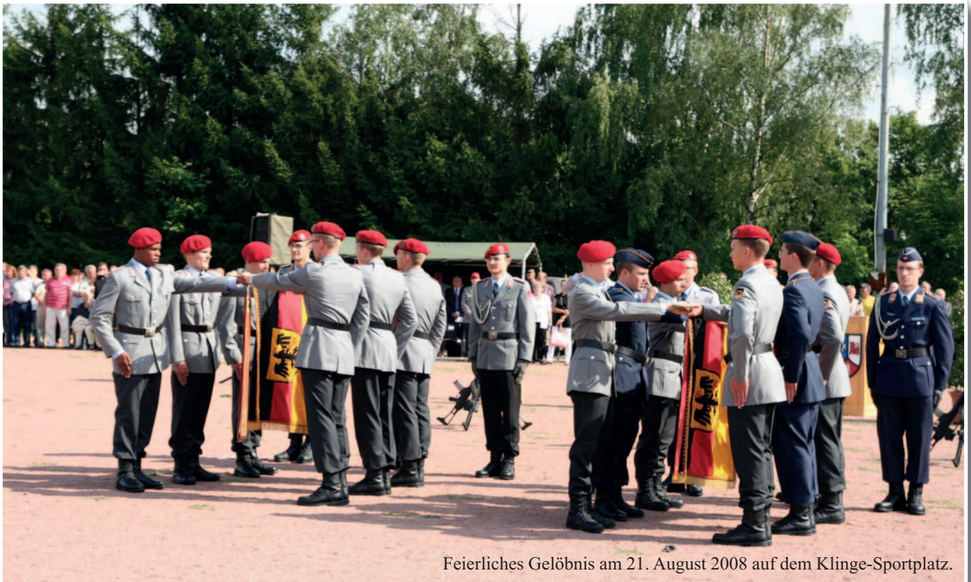
Feierliches Gelöbnis am 21. August 2008 auf dem Klinge-Sportplatz.