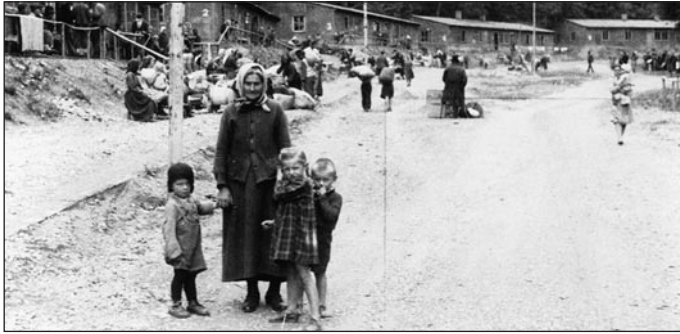
Im Lager Teufelsklinge

Nach den Feierlichkeiten, zu welchen hiermit herzlich eingeladen wird, besteht die Gelegenheit, das an diesem Tage stattfindende Klingefest zu besuchen; Nähere Informationen hierzu gibt es unter www.klinge-seckach.de .