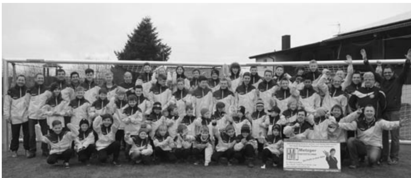
Stolz präsentieren sich 65 Kinder und Jugendliche sowie 12 Jugendtrainer des SVG in ihren neuen Outfits vor den ebenfalls neuen Toren.

Am 7. März 2014 fand die diesjährige Mitgliederversammlung der Abteilung Volleyball des SV Großeicholzheim statt. Hauptthema der Versammlung war ein geplanter Generationenwechsel in der Abteilungsleitung, mit dem Ziel einer Verjüngung der Vorstandschaft.