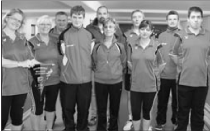
SC Klinge Seckach