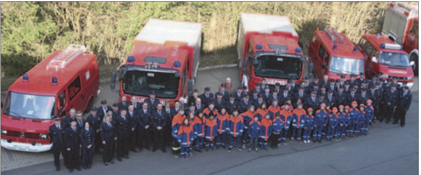
„Ein imposantes Bild: die Freiwillige Feuerwehr Seckach vor den beiden neuen Staffellöschfahrzeugen LF 10/6.“