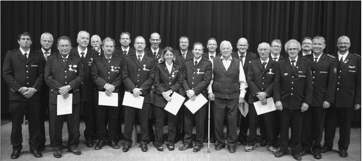
„Ehrungen für langjährige Zugehörigkeit zur Feuerwehr“