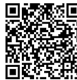
QR-Code Meldeplattform Asiatische Hornisse

Um möglichst rasch Maßnahmen zum Fang der Königinnen und Beseitigung der Nester der Asiatischen Hornisse zu veranlassen, bittet das Ministerium für Umwelt, Klima und Energiewirtschaft um Meldung von Sichtungen in Baden-Württemberg. Dies ist über die Meldeplattform auf der Homepage der Landesanstalt für Umwelt (LUBW), aber auch über die kostenlose „Meine Umwelt-App“ möglich.